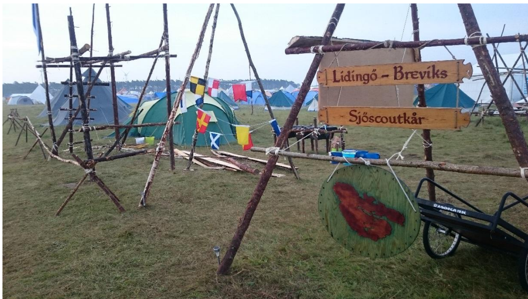
Jamoboree17, Rinkaby, Skåne